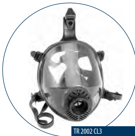
TR 2002 CL3