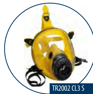
TR2002 CL3 S