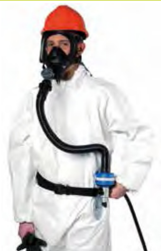
AC 190 TR82