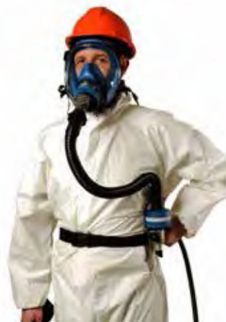
AC 190 TR2002