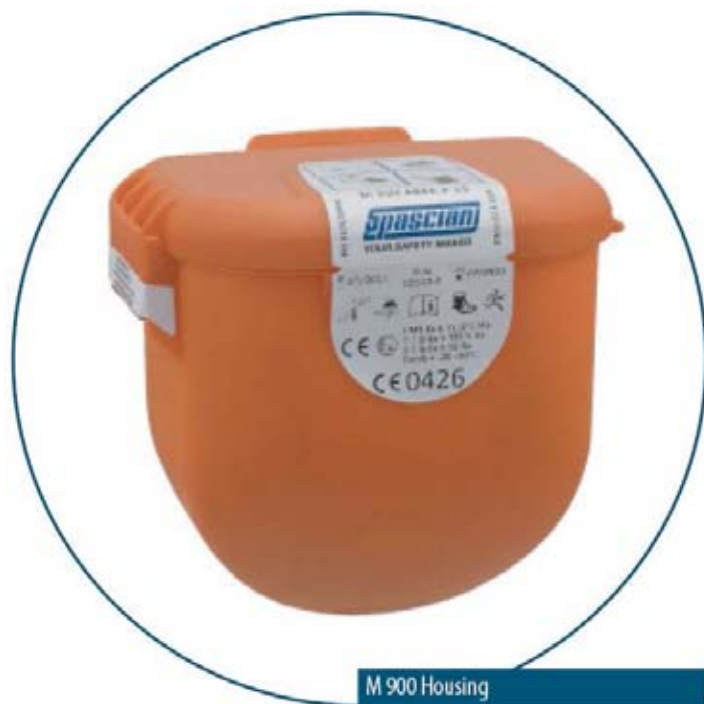
M 900 Housing

Istotną cechą użytkową serii M 900 jest niska waga całkowita półmasek ucieczkowych w pojemnikach ochronnych.