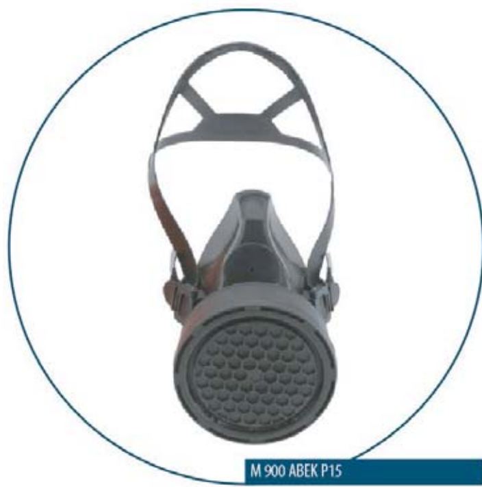
M 900 ABEK P15