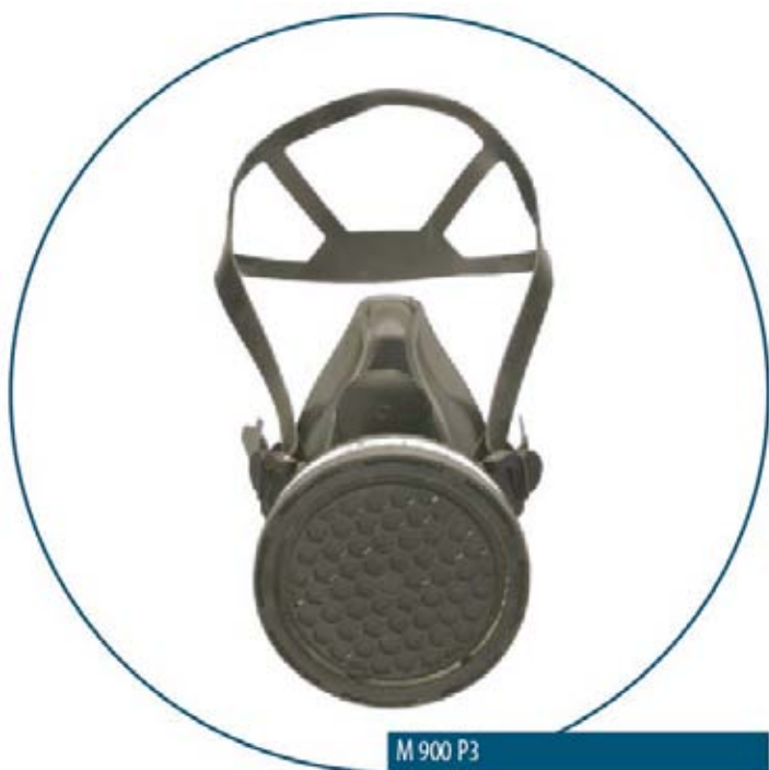
M 900 P3