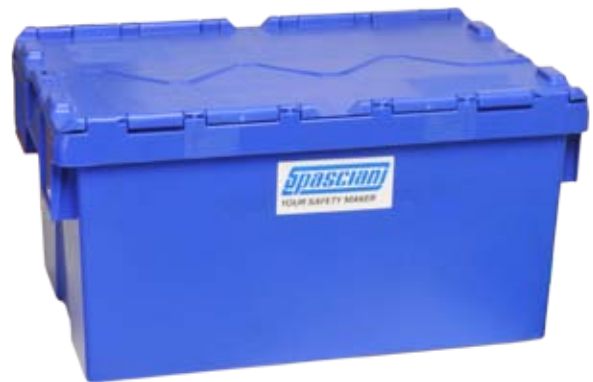
Pudełko transportowe z ABS