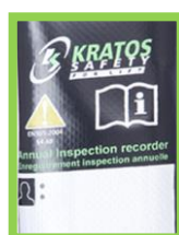
Covered identification label