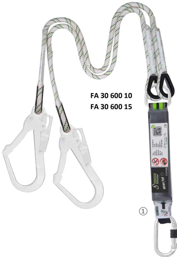
FA 30 600 10 FA 30 600 15