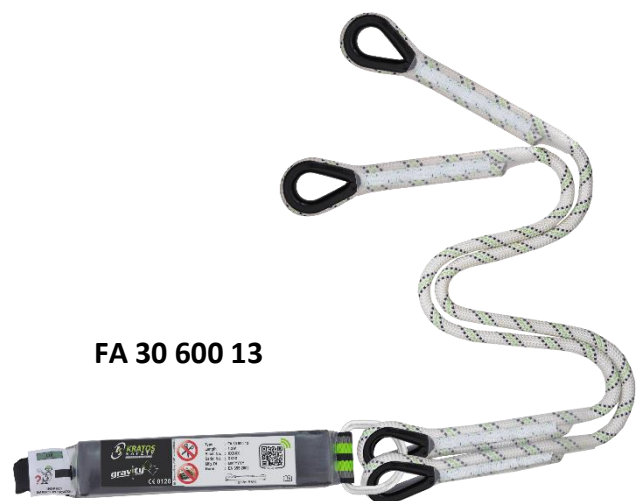
FA 30 600 13