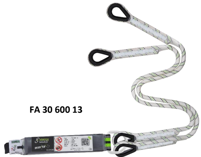
FA 30 600 13