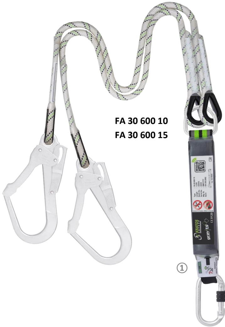
FA 30 600 10 FA 30 600 15