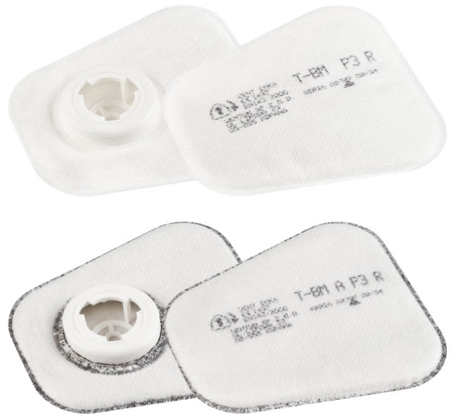
T-BM A P3 R

Filtr T-BM A P3 R dodatkowo chronią przed odorami i nieprzyjemnymi zapachami oraz drażniącym działaniem aerozoli i par substancji organicznych. Umożliwia to użytkowanie sprzętu ochronnego wyposażonego w filtry T-BM A P3 R w atmosferze skażonej substancjami organicznymi pod warunkiem, że ich stężenie nie przekracza wartości NDS (Najwyższe Dopuszczalne Stężenie). Mogą być używane dłużej niż przez jedną zmianę roboczą.