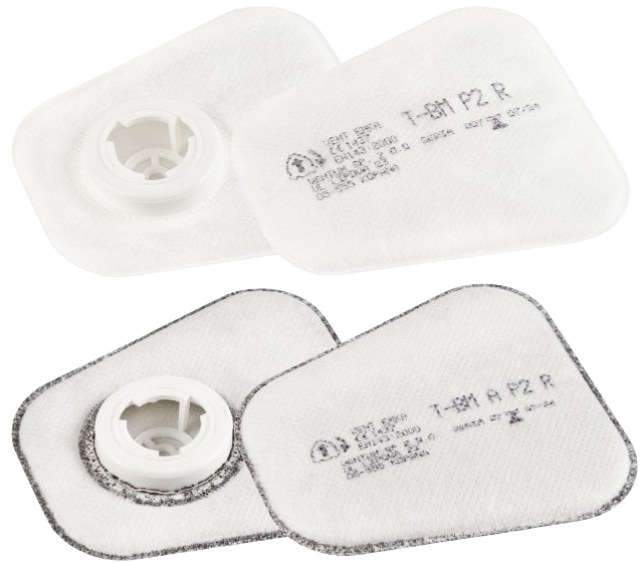
T-BM A P2 R

Filtry T-BM A P2 R dodatkowo chronią przed odorami i nieprzyjemnymi zapachami oraz drażniącym działaniem aerozoli i par substancji organicznych. Umożliwia to użytkowanie sprzętu ochronnego wyposażonego w T-BM A P2 R w atmosferze skażonej substancjami organicznymi pod warunkiem, że ich stężenie nie przekracza wartości NDS (Najwyższe Dopuszczalne Stężenie). Mogą być używane dłużej niż przez jedną zmianę roboczą.