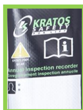
Étiquette d'identification protégée