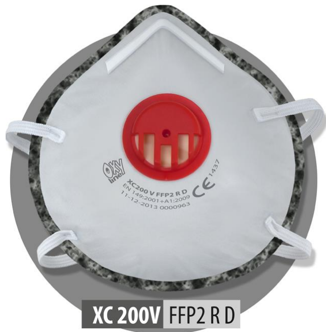
XC 200V FFP2 R D

Exemples d'application : solides moyennement toxiques, amiante, cuivre, baryum, titane, vanadium, chrome, manganèse, poussière de bois dur, poussière de charbon contenant plus de 10 % de silice libre, exploitation minière, chimie, métallurgie, travail du bois dur.