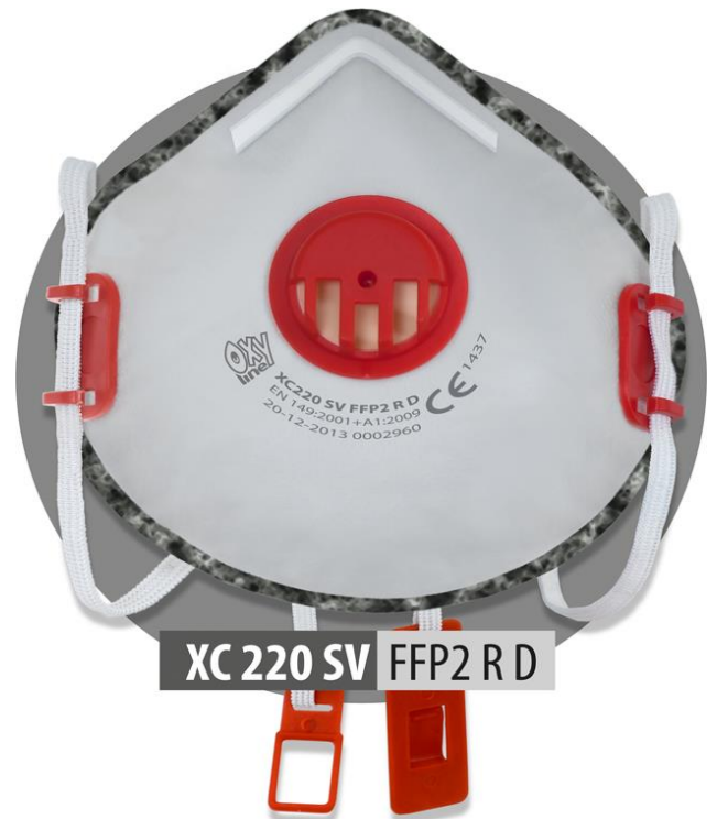
XC 220 SV FFP2 R D