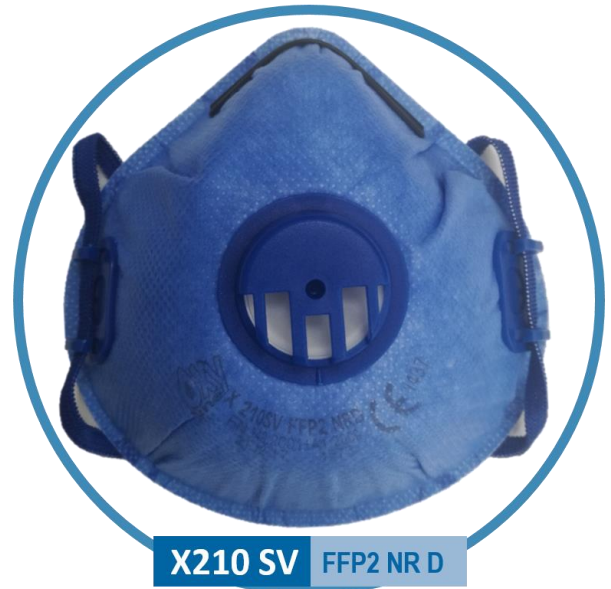
X210 SV FFP2 NR D

Die filtrierende Halbmaske besteht hauptsächlich aus einem Gesichtsteil aus einem filtrierenden Material und, je nach Halbmaskenmodell, aus Hilfszubehör wie Kopfbändern, Ausatemventil oder Bandhaltern. Die aus der Umgebung eingeatmete Luft durchströmt das filtrierende Material, wo sie gereinigt wird. Die ausgeatmete Luft wird durch das Material des Gesichtsteils (bei Halbmasken ohne Ausatemventil) oder durch das Ausatemventil, das in der Schale platziert ist und das Gesichtsteil der Halbmaske (bei Halbmasken mit Ausatemventil) nach außen abgeführt. Die Schale der Halbmaske sollte während der Benutzung eng am Gesicht anhaften.