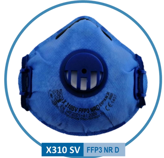
X310 SV FFP3 NR D

L'air inhalé de l'environnement passe à travers le matériau filtrant, où il est nettoyé. L'air expiré est évacué à l'extérieur par le matériau de la partie faciale (pour les demi-masques sans soupape d'expiration) ou par la soupape d'expiration placée dans la voilure et la partie faciale du demi-masque (pour les demi-masques avec soupape d'expiration). Les cuvettes du masque doivent être bien collées au visage pendant l'utilisation.