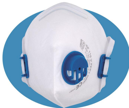
XF 110V FFP1 NR D

Przykładowe zastosowanie: przemysł rolniczy, spożywczy, pyły nietoksyczne, zastosowanie w kamieniołomach, cementowniach, przemyśle drzewnym przy obróbce drewna miękkiego (iglaste), a szczególnie zaś do takich pyłów jak węgiel wapnia, grafit naturalny i syntetyczny, gips, kreda, cement, tynk, marmur, tlenek cynku, pyłki roślinne, celuloza, siarka, bawełna, opiłki metali żelaznych, pył węglowy zawierający poniżej 10% wolnej krzemionki.